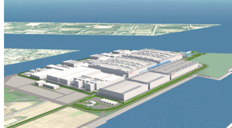
新工場(最終完成予想図)