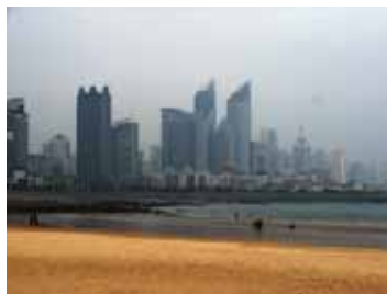
チンタオの街並み

1次選考で3名を内定しましたが、今年の募集予定人員は5名で、まだ定数に達していません。引き続き、2次募集を実施しましたところ応募者があり、追加で1名の内定を決めることができました。