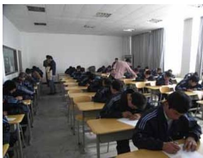
筆記試験をしているところ