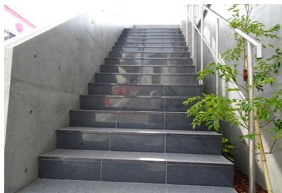
玄関へ向かう階段